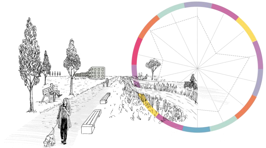
Outil : Place Standard tool, Scotland

=> Publication à sortir à l'automne 2023